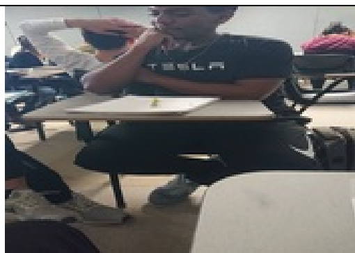
與同學上課討論課題