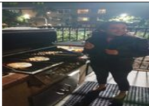
與伊朗室友一起烤肉慶祝期末考結束