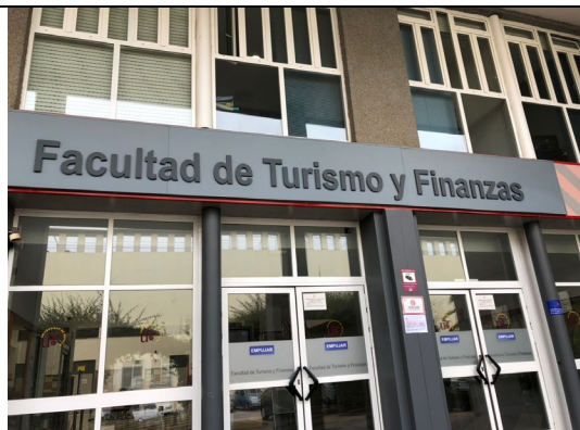
姊妹校旅遊與會計學院正門口